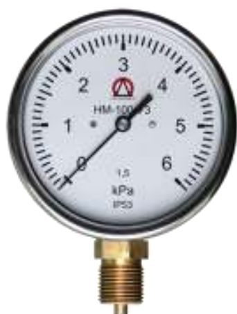
Напоромер НМ-100 с радиальным штуцером